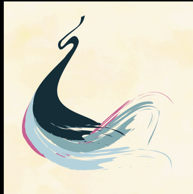
Single "Follow The River" 2025