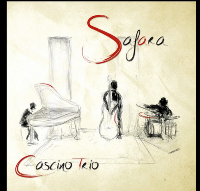
Album "Safara" 2013