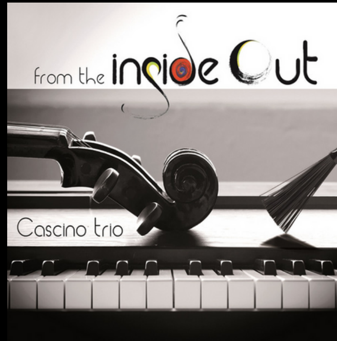
Album "From The Inside Out" 2019